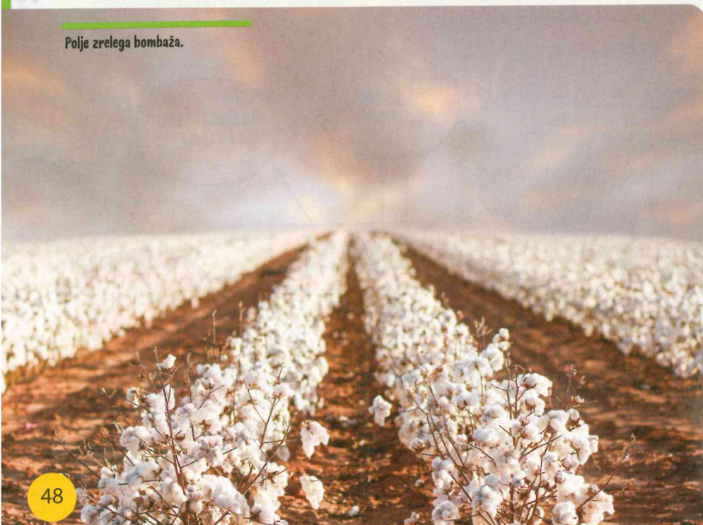
Polje zrelega bombaža.

nine lahko dosežejo vodo tudi na globinah do štirih metrov. Kmetom zagotavlja zanesljiv dohodek na območjih, kjer je kmetijstvo resno ogroženo zaradi podnebnih sprememb in/ali ponavljajočih se suš. Je ena redkih rastlin, ki uspeva tudi v slanem okolju. Največji problem pri gojenju bombaževca so škodljivci. Za njihovo zatiranje porabijo okrog 16 % vseh insekticidov v kmetijstvu, kar uničuje okolje, tj. onesnažuje vodo in uničuje plodno zemljo. Upoštevanje strategij trajnostnega kmetovanja, odgovorna in etična trgovina bodo zagotovili, da bo bombaž na razpolago tudi v prihodnosti.