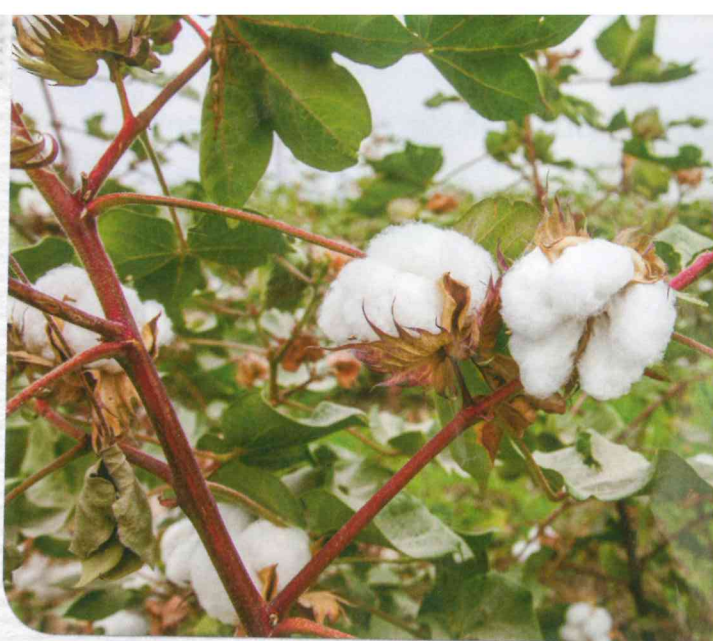
Bombaževc zraste od 100 do 150 cm visoko.

Bombaževc je grmičasta trajnica, ki jo zaradi strojnega obiranja gojijo večinoma kot enoletno rastlino. Rast bombaževca od sejanja do obiranja vlaken traja od šest do sedem mesecev. Po treh mesecih začne cveteti in cveti do 100 dni. Na eni rastlini se oblikuje od 40 do 80 cvetov, ki privablja jo žuželke. Cvet odpade že po treh do štirih dneh in na njegovem mestu se začne razvijati plod, ki v dveh mesecih doseže velikost kokošjega jajca. Notranjost ploda je razdeljena na tri do štiri prekate, v katerih zraste od tri do deset semen, gosto prekritih z vlakni. Vlakna rastejo iz semenske pokožice, tako da se celice podaljšajo v cevkam podobno obliko. Plod po približno dveh mesecih dozori in poče. Vlakna se na soncu hitro posušijo. Seme lahko naravno potuje z vetrom in po vodi do primernege mesta, kjer se iz njega razvije nova rastlina; lahko pa pridelovalci plodove oberejo.