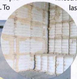
Bale surovega bombaža