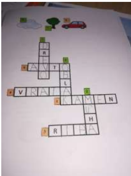
(Ustvarjanje doma; ustvaril: Tjan Dražetić)

Prav tako nismo pozabili na naše drage mamice.