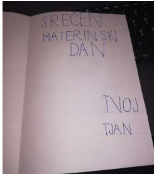
(Utvarjanje doma; ustvaril: Tjan Dražetić)

Poslušali smo različne zgodbe in pravljice, po zgodbah smo risali pravljичne junake.