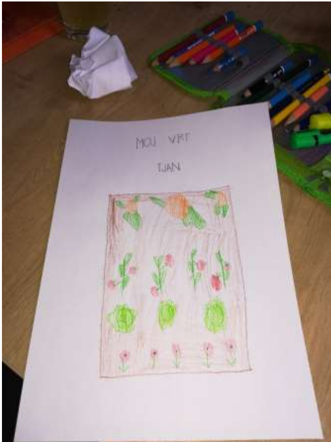
(Ustvarjanje doma; ustvaril; Tjan Dražetić)