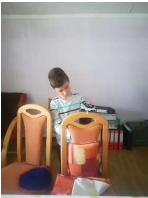
(Ustvarjanje doma; ustvaril: Lukas Bauer)

Imeli smo kar nekaj nalog na učnih listih. In sicer naloge v povezavi s: trajnostno mobinostjo in mobilnimi sredstvi, zdravo prehrano (gibanje in zdravje), ustvarjanje spomladanskega šopka itd.