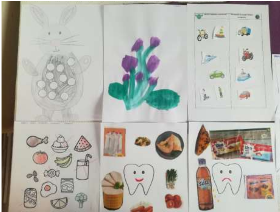
(Ustvarjanje doma; ustvaril: Lukas Bauer)