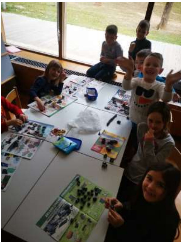
Ustvarjali smo gregorčke.