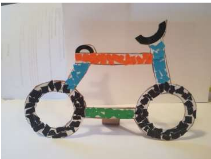
(Delo na domu; ustvaril: Lukas Bauer – 1. c)

Kljub temu, da smo bili doma, so otroci pridno ustvarjali tudi lutke (prstne, senčne in ročne lutke). Ustvarjali smo ročno lutko oz. lutko iz nogavice.