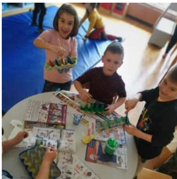
Pogovarjali in reševali smo različne naloge v povezavi z trajnostno mobilnostjo. Ustvarili smo tudi makete prevoznega sredstva, ki pozitivno vplivajo na naše okolje.