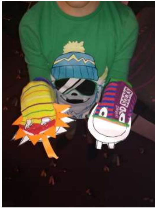
(Ustvarjanje doma; ustvaril: Tjan Dražetić)