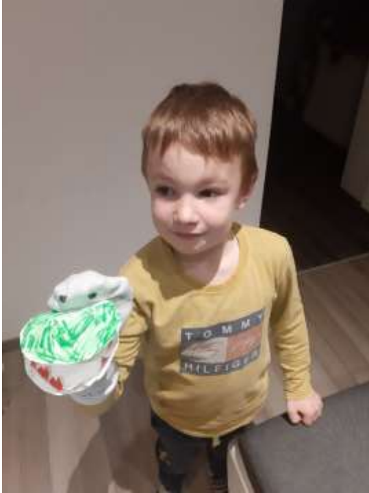
(Ustvarjanje doma; ustvaril: Val Koleta)